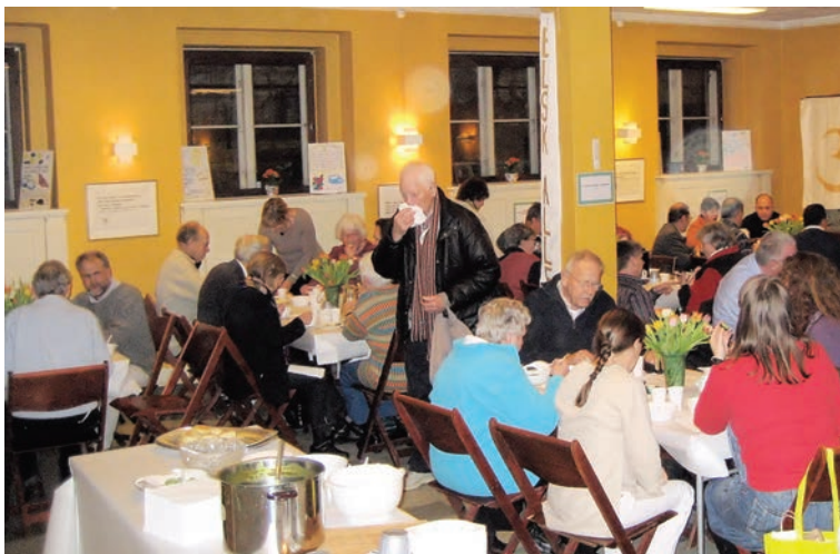
Ur: Sanathana Sarathi , februari 2011.

Den danska Sathya Sai-organisationen inbjöd allmänheten att få delta i firandet av Sai Babas 85:e födelsedag den 23 november 2010 i Unitarernas kyrka i Köpenhamn. Över 100 personer kom och deltog i födelsedagsfirandet. Programmet startade med två timmars lovsång och en video-presentation av Sathya Sai Baba, som bl.a. visar när Han ger Darshan, när Han delar ut mat till de fattiga och hängivna som får uppleva Hans gudomliga kärlek under Darshan. Man hade också anordnat en utställning och bokförsäljning för att inspirera och informera deltagarna om Sathya Sai Babas undervisningssystem (Educare), ideellt arbete, studiecirklar och ljusmeditation. Inbjudna talare berättade om sina personliga upplevelser med Sai Baba. Födelsedagsfirandet avslutades med att tre Sai-hängivna spelade musik från Chile.