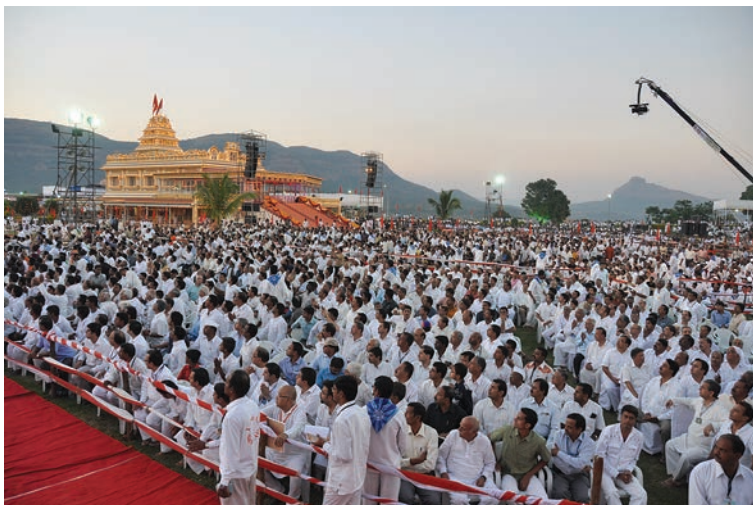
Sai-hängivna i Hadshi nära Pune

Ur: Sanathana Sarathi , december 2009, sid. 366-370.