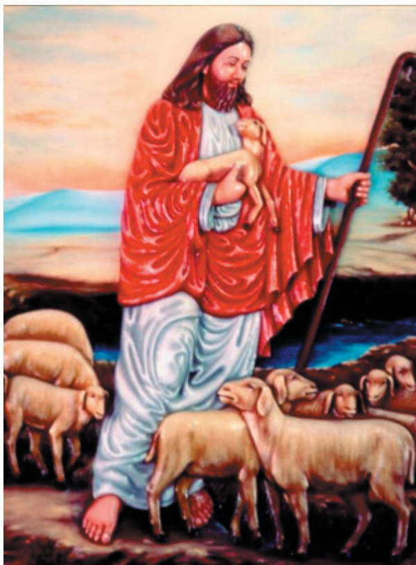
Jesusbild från Poornachandra Hall i Prasanthi Nilayam