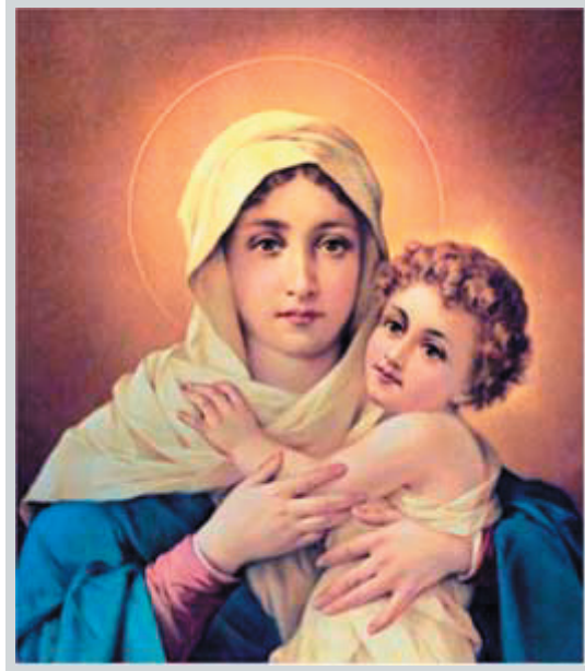
Maria och Jesusbarnet